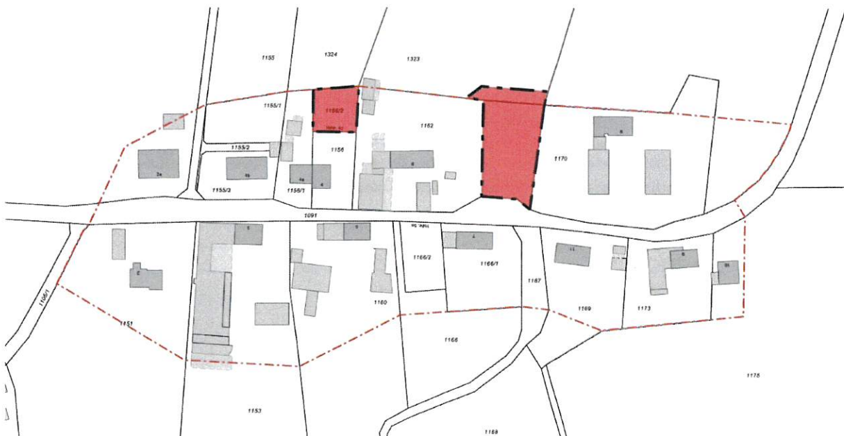
Geltungsbereich und Lageplan zum Bebauungsplangebiet (rot gekennzeichnet und mit schwarzer Punkt-Strichlinie umrandet)

Der Geltungsbereich dieser 3. Änderung betrifft die Flnr.: 1156/2; 1162 sowie 1323, jeweils Gemarkung Rattenkirchen. Die Durchführung erfolgt gem. § 13 BauGB im vereinfachten Verfahren.