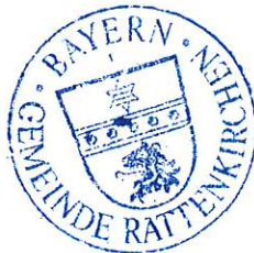
Rainer Grellmeier Erster Bürgermeister